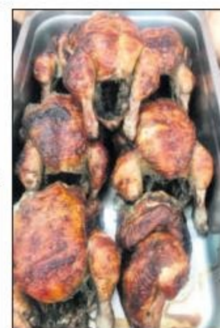
Pica Pollo - Medio Pollo y hopi cuminda mas

PA PEDIDOS Tel. 566-0319 Whatsapp Cel. 566-0319